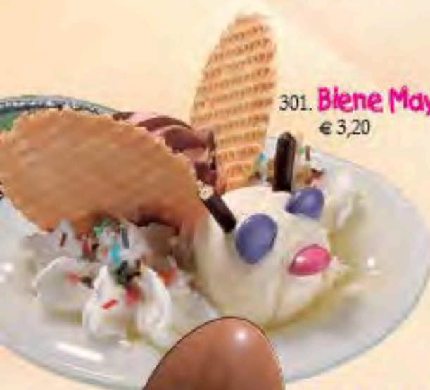
301. Biene Maya 1ACF € 3,20