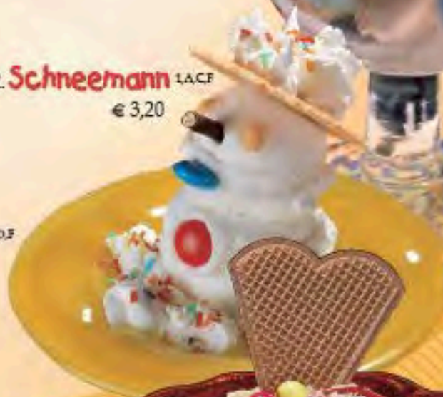
302. Schneemann 1ACF € 3,20