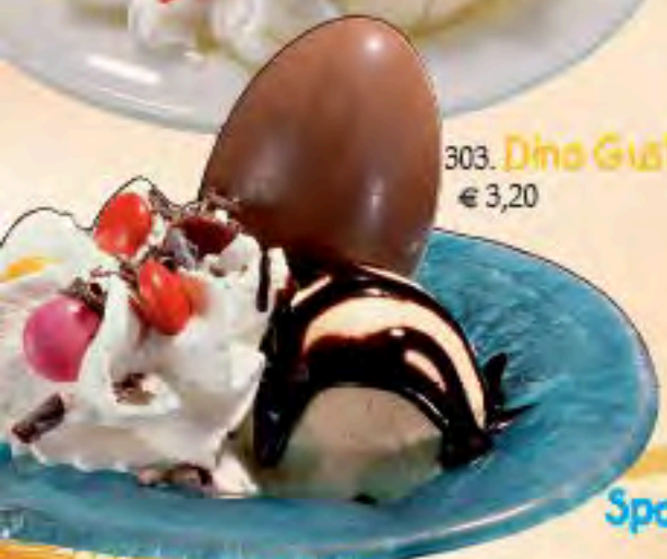
303. Dino Gustav 1ADF € 3,20